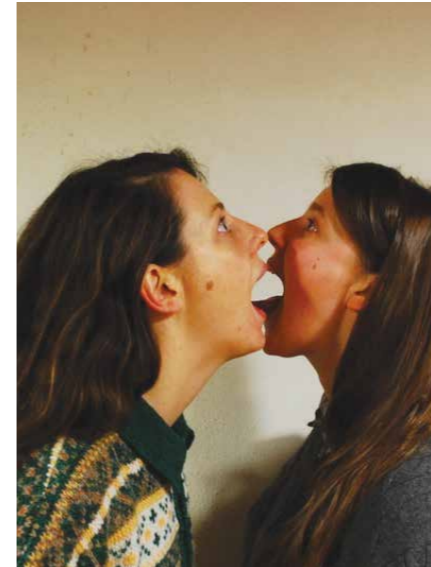
Die Schwärmer © Franz Xaver Mayr