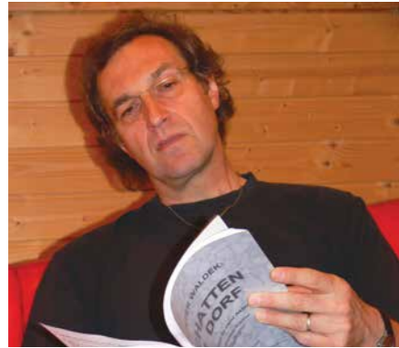
Gunter Waldek