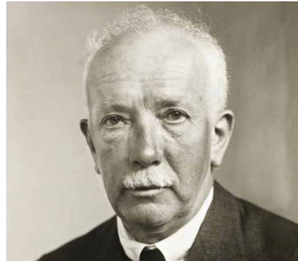
Richard Strauss 1925

Klaviermusik von Richard Strauss zum 150. Geburtstag