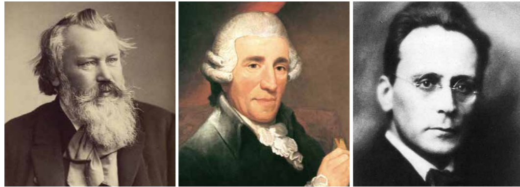
Johannes Brahms 1889