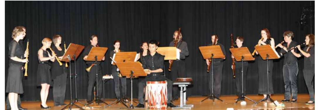
Doppelrohrblattspieler/innen der ABPU und der Konservatorium Wien Privatuniversität