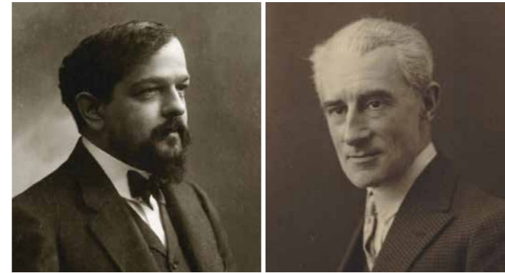
Claude Debussy ca. 1908 Foto von Félix Nadar