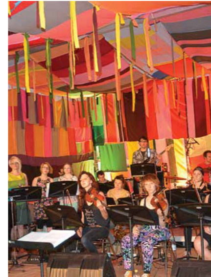
Summerjazznites 2013 Kunstuni Linz

In Zusammenarbeit mit der Kunstuniversität Linz