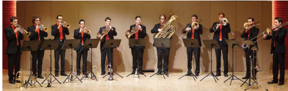
Lentia Brass