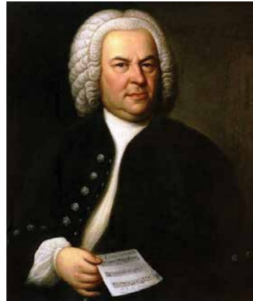
Johann Sebastian Bach im Alter von 61 Jahren Gemälde von Elias Gottlob Haussmann

Ein Tag für Johann Sebastian Bach zum 329. Geburtstag